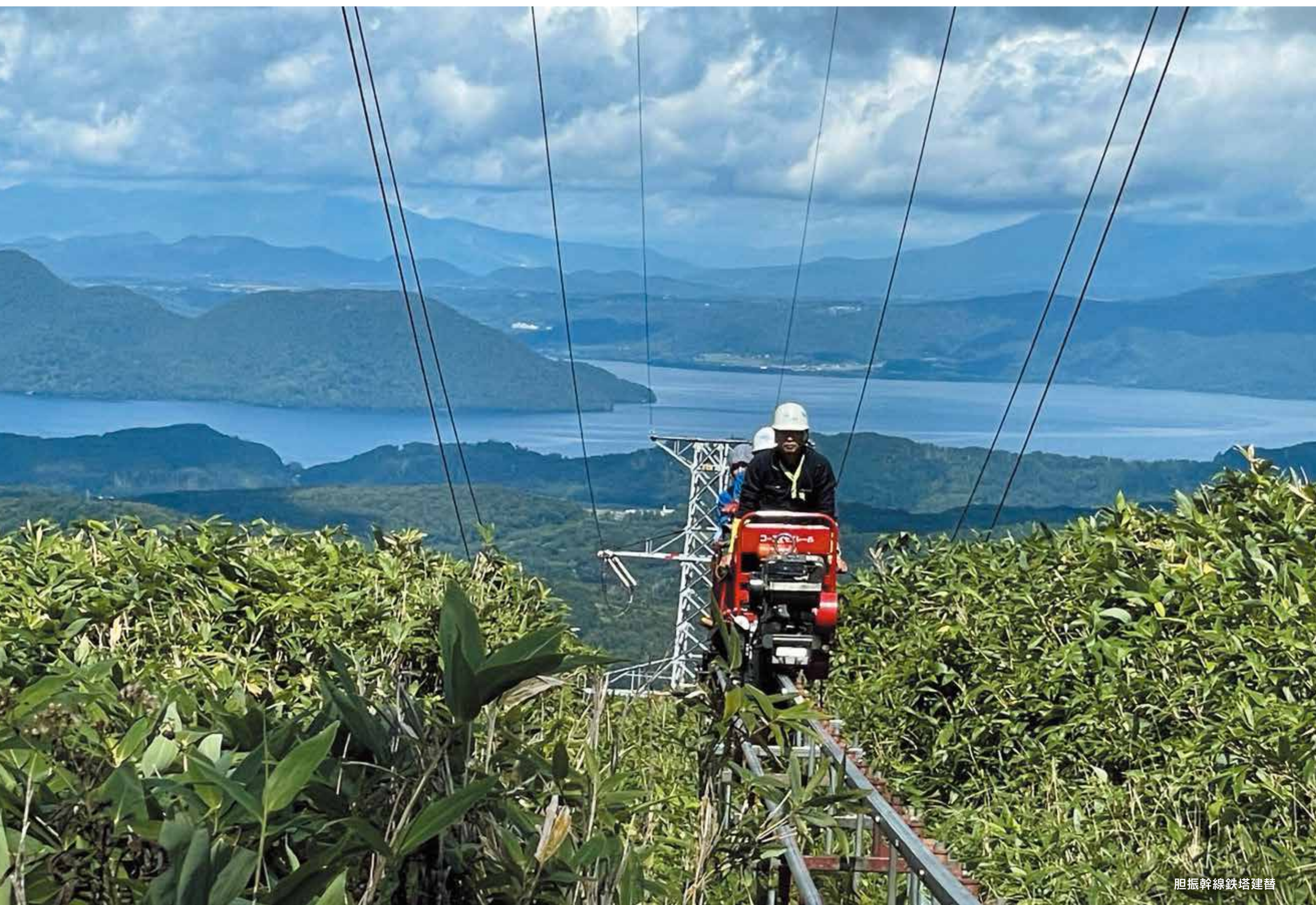
胆振幹線鉄塔建替