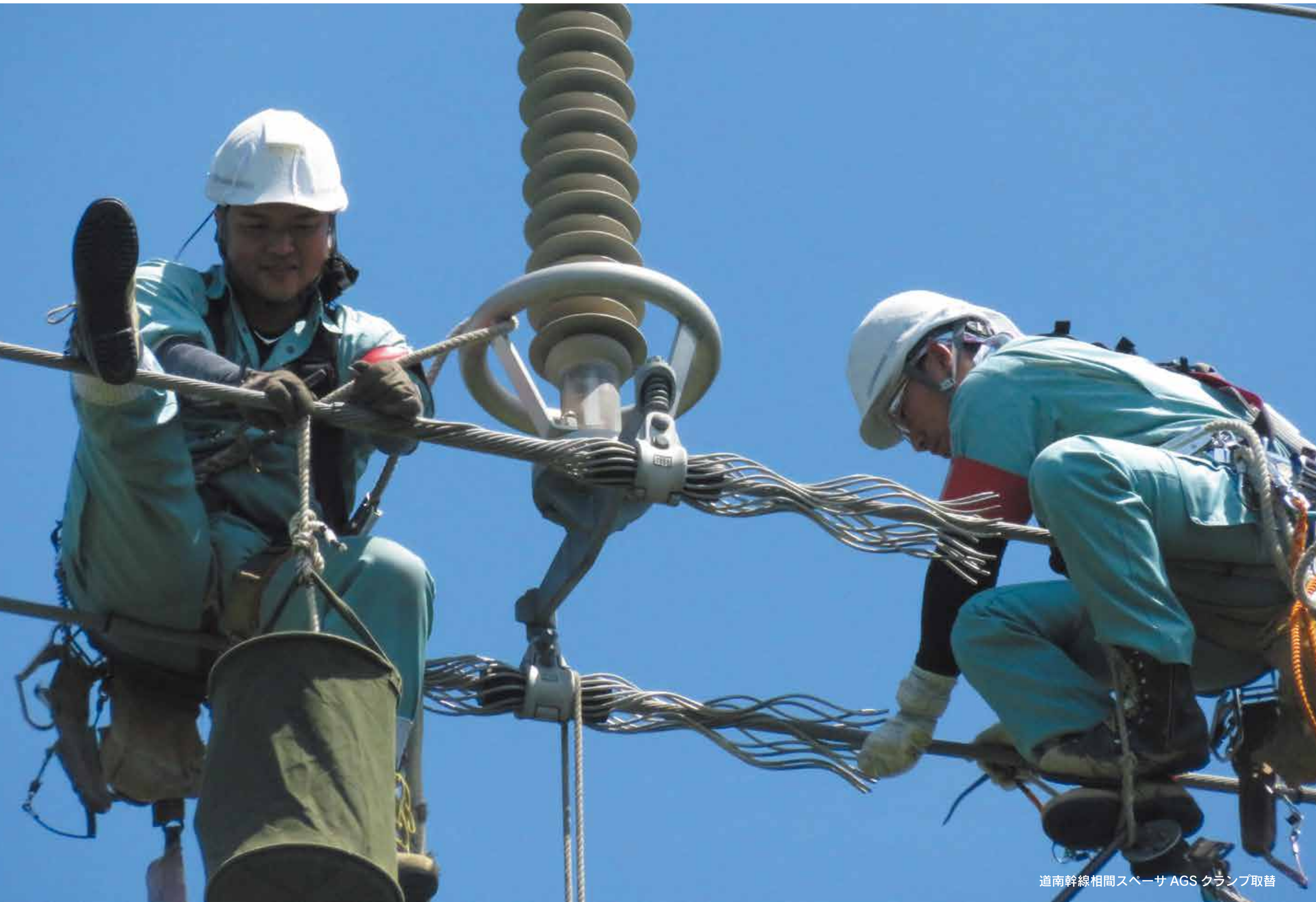
道南幹線相間スベーサ AGS クランプ取替