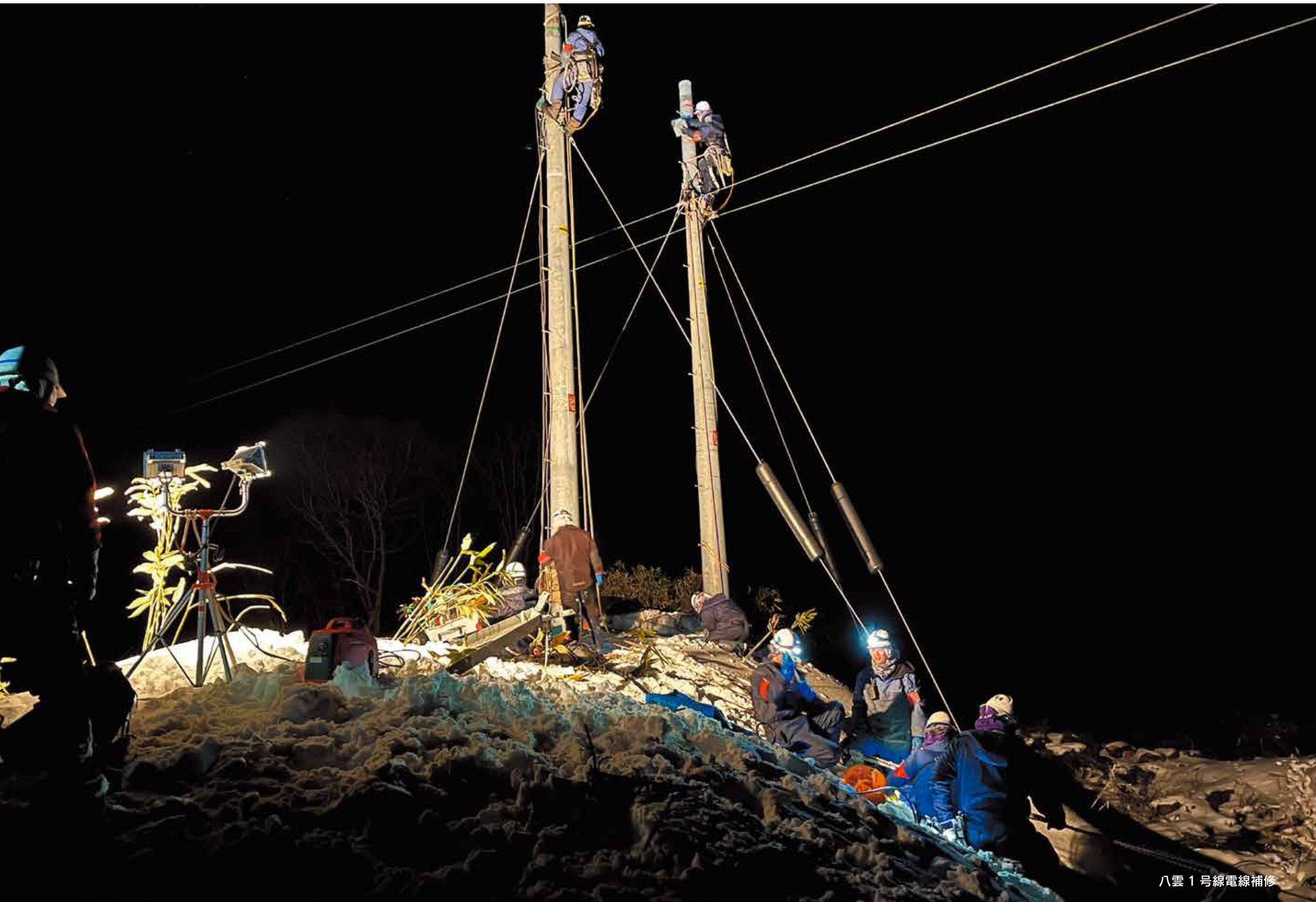
八雲1号線電線補修