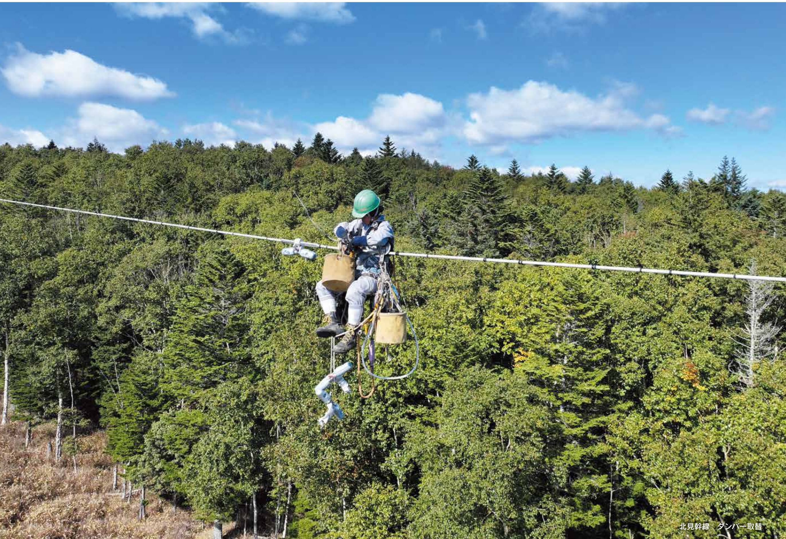
北見幹線 タンバー取替