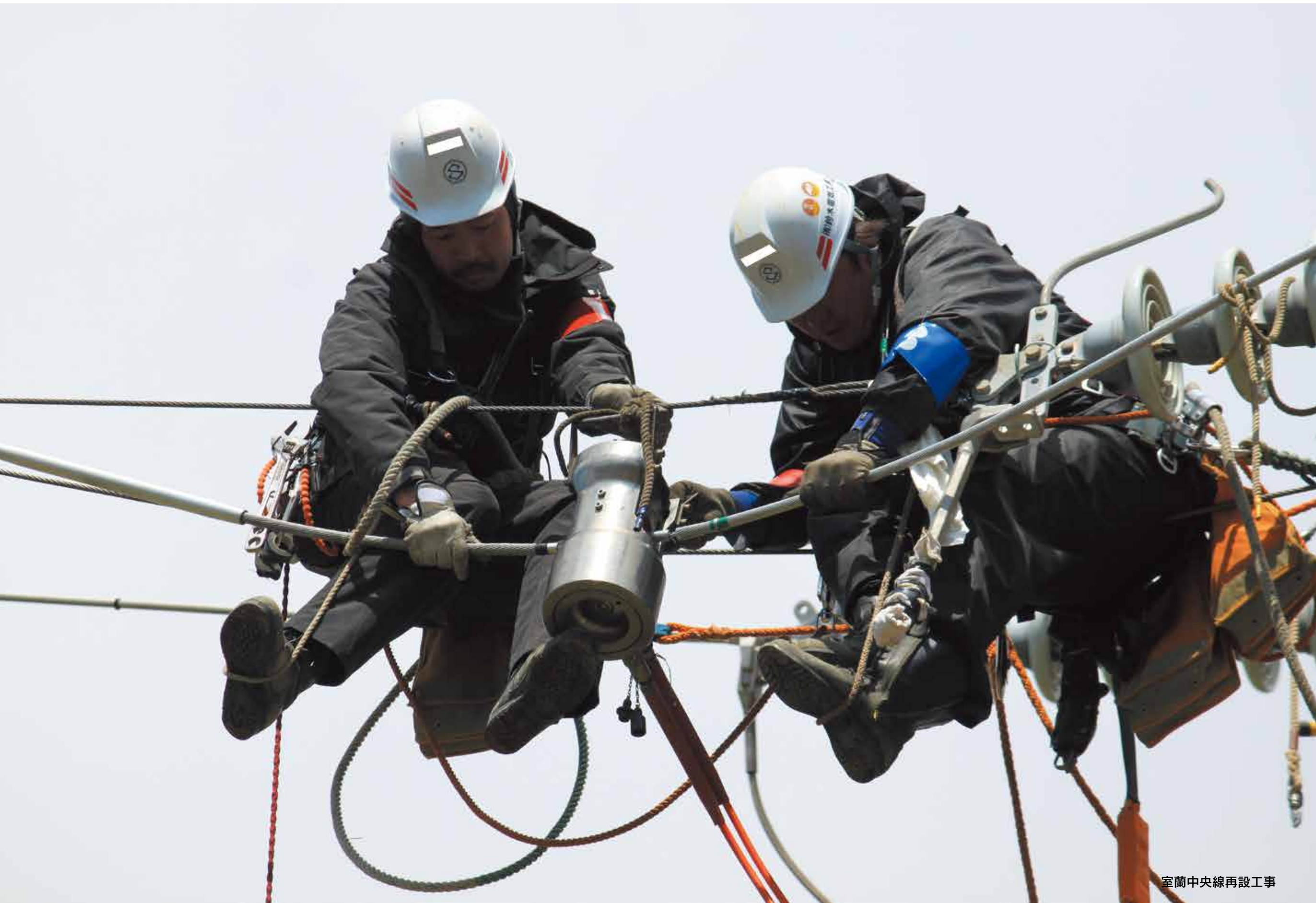
室蘭中央線再設工事